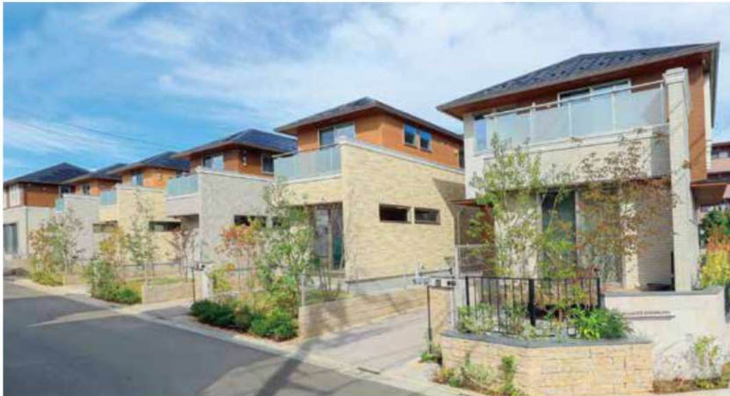
※掲載の写真は現地街並みを撮影(2022年10月)したものです