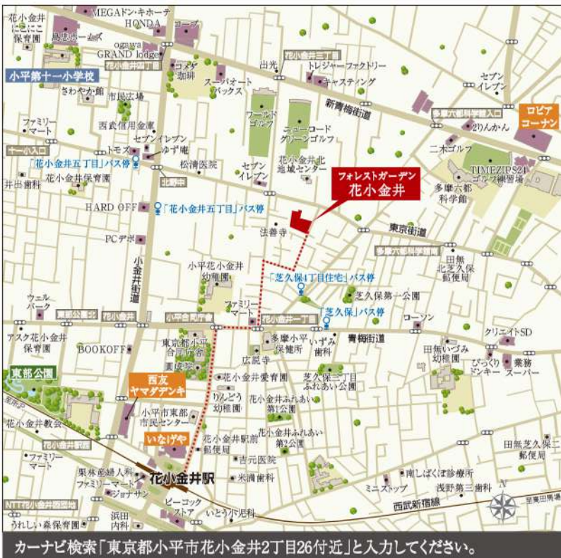
カーナビ検索「東京都小平市花小金井2丁目26付近」と入力してください。