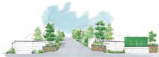
街の入口の顔となる、タウンゲートと 高さ1.4mのタウンウォール。