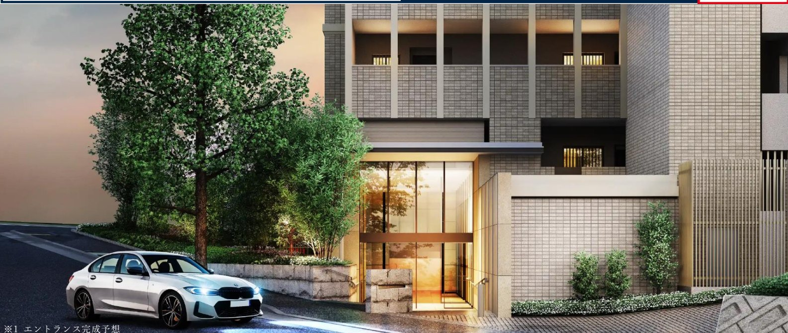
※1 エントランス完成予想

小田急線快速急行利用「新百合ヶ丘」駅より 「新宿」駅へ30分(日中時23分) ペDESTリアンデッキがつながる駅前 充実の商業・公共施設 住宅街が広がる落ち着いた街並み 「王禅寺公園」へ徒歩6分 (約420m) 全79邸のゆとりと開放のプラン 専有面積平均72㎡超 新百合ヶ丘駅エリアで「初」 ZEH-M Oriented & 低炭素住宅