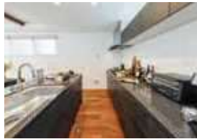
※掲載の写真は現地街並みを撮影(2023年10月)したものです。※一部分譲済住戸含む※掲載の室内写真はモデルハウス(5号棟)を撮影(2023年10月)したものです。※家具・備品等は価格に含まれません。