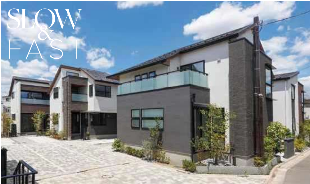
外観写真(2023年7月撮影)